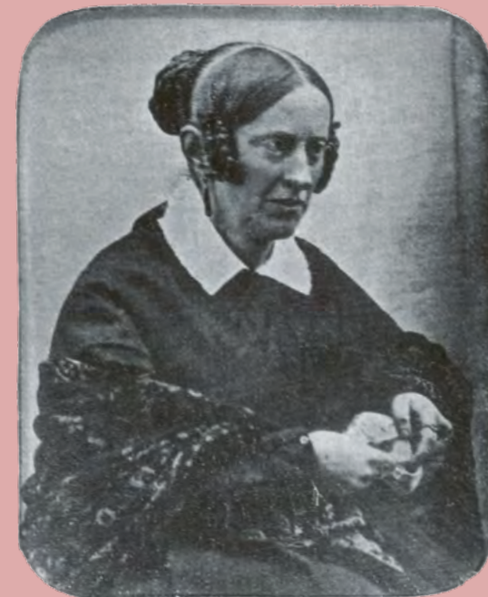
Bildnis der Annette von Droste-Hülshoff, Daguerreotypie, ausgeführt von Friedrich Hundt, gerahmt, 1845. Digital restaurierte Version.

die einzigen Fotografien Annette von Drostes entstanden sind, sondern auch Fotogesichte geschrieben wurde. Sein reich bebildeter Vortrag eröffnet viele spannende Perspektiven – auf die Literatin, den Lichtbildner, die Zeit des Biedermeier und der Geschichte der Fotografie.