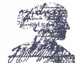
Annette von Droste- Gesellschaft