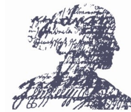
Annette von Droste-Gesellschaft