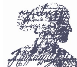
Annette von Droste-Gesellschaft