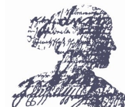
Annette von Droste-Gesellschaft